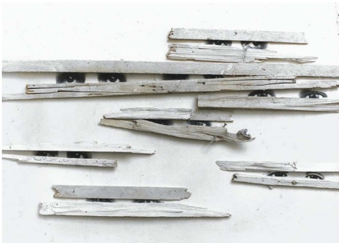
Graciela Sacco, de la serie Esperando a los Bárbaros, Entre nosotros , 1996, heliografía sobre papel y fragmentos de madera, dimensiones variables. En Rolf Art