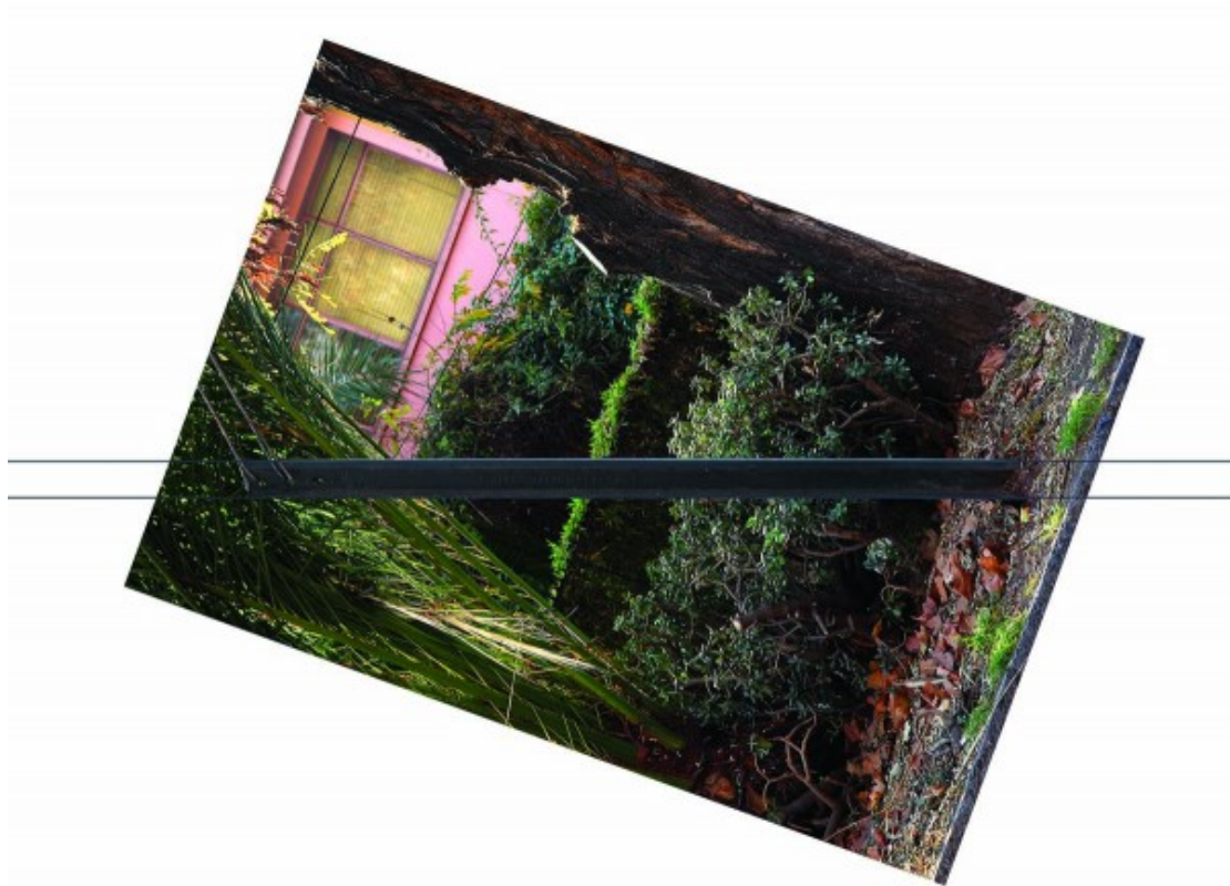
Cristián Silva-Avaria, Memory Stick # 6 (Dewlaps steel 1903), 2015, impresión glicée sobre papel de algodón, cuerda y pigmento vegetal, 320 x 240 cm. En Artespacio

Programa VIP. Como una forma de lograr nexos con la ciudad, cada año este programa traspasa los límites del evento, ofreciendo a un grupo de destacados coleccionistas e invitados nacionales e internacionales recorridos exclusivos por colecciones públicas y privadas, galerías, museos y talleres de Santiago, lo que les permite formarse una panorámica de la escena del arte moderno y contemporáneo de Chile.