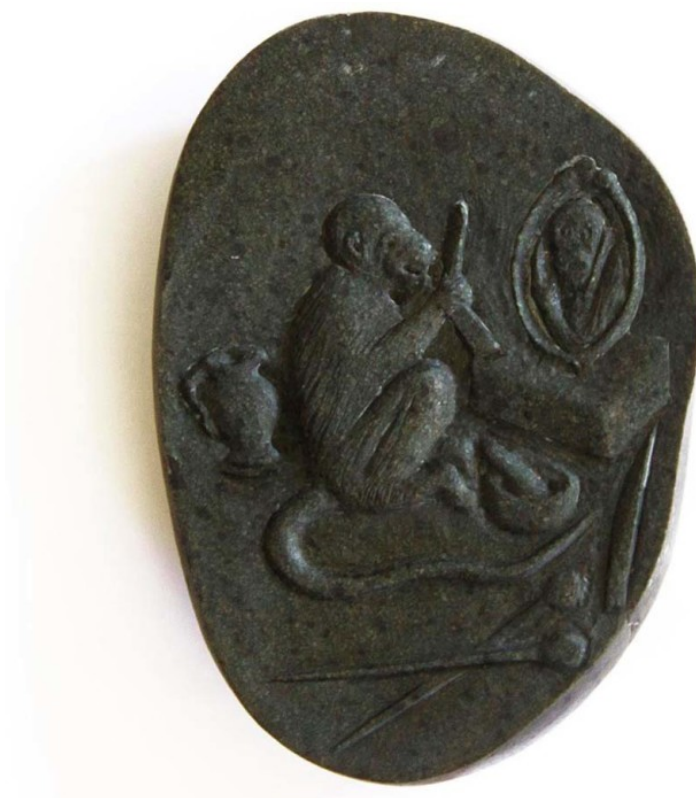
Alejandra Prieto, Mono con navaja (Mulato Gil), 2015, bajorrelieve sobre piedra, 14 x 10 x 4 cm. Edición de 3 + PA. En Die Ecke Arte Contemporáneo

Tal como el año pasado, habrá dos días exclusivos -el 23 y 24 de septiembre- dedicados a profesionales e invitados al Programa VIP, una serie de jornadas enfocadas a un público especializado que contará con visitas guiadas organizadas por Fundación FAVA Chile .