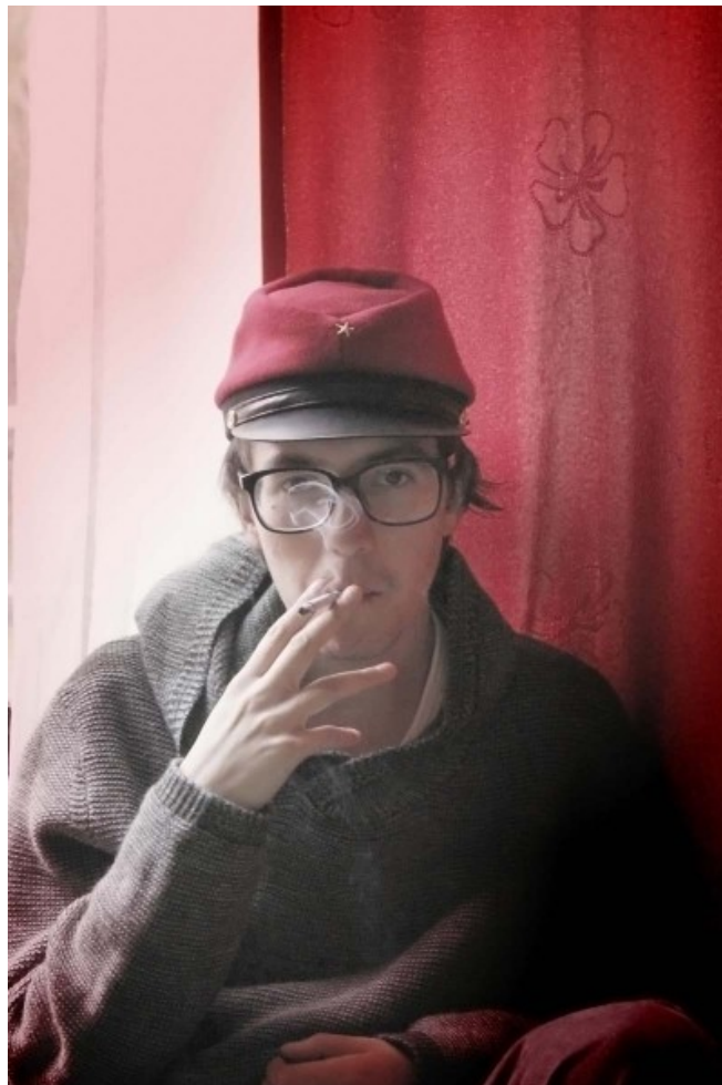
Carlos Rojas Montana, S/T (de la serie Glorias de Atacama), 2013, impresión digital, 13 x 18. En Colectivo Atacama Panorámica, sección Pop_Up

“Entre sus objetivos principales, poniendo siempre en primer lugar la individualidad y subjetividad de la práctica artística, está la voluntad de trabajar juntos, de unir fuerzas para poder acercar el arte a las personas, abarcar nuevos públicos y enriquecer la escena cultural contemporánea. En el presente los Pop_Up tienen como denominador común una voluntad transformadora y una mirada desprovista de juicios, a través de la cual observan los cambios y mutaciones que ha experimentado el escenario cultural chileno en los últimos años, y donde ellos son agentes activos fundamentales”, escribe Castro Jorquera en el catálogo de esta séptima edición de la feria.