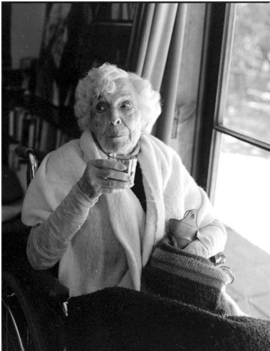
Paz Errázuriz, Sin Título, 1992, impresión en inyección de tinta pigmentada sobre papel Canson platino, 31 x 21 cm. En Galería AFA

Además, este año colaboran otros medios en alianza con Ch.ACO'15, como Artfacts (Alemania), Arte Informado (España), Artprice (Francia), Chile Deluxe (Chile), La Panera (Chile), Viernes (Chile), The Art Newspaper (Estados Unidos), y Widewalls (Suiza).